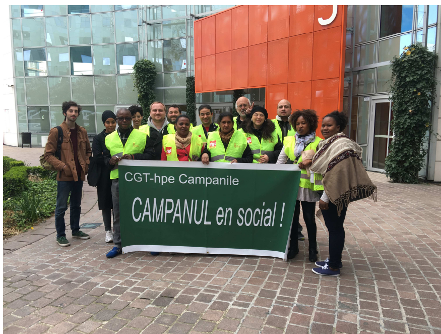
Visite au siège à La Défense ce vendredi 15 avril !