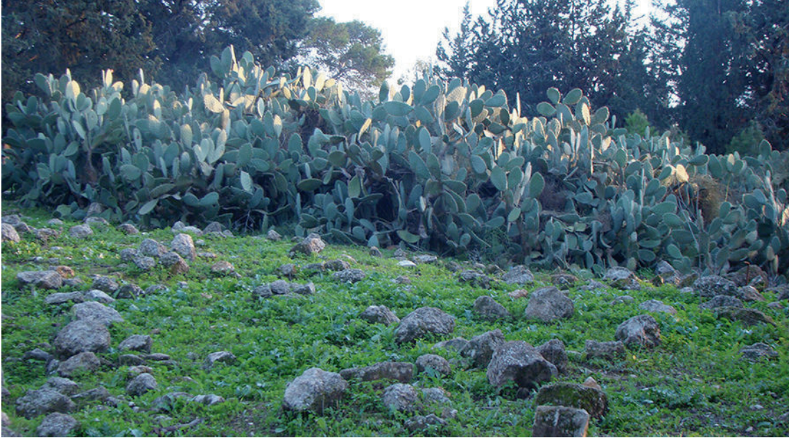
Le village palestinien Al Ruwayyis près de Acre/ Photo de Mostafa Minawi (2015).

Cela a changé quand une fois, une personne expulsée de l'un des villages nous a vus marcher dans la confusion et est venue vers nous pour nous questionner. Les habitant.e.s de ce village ont été déplacé.e.s de force, ils ont donc érigé une nouvelle colonie juste à côté leur village d'origine a été élevé terre et enterré. [...] Un habitant nous a montré où le cimetière du village était/est. [...] Les cimetières détiennent les secrets de l'endroit où les villages sont enterrés.