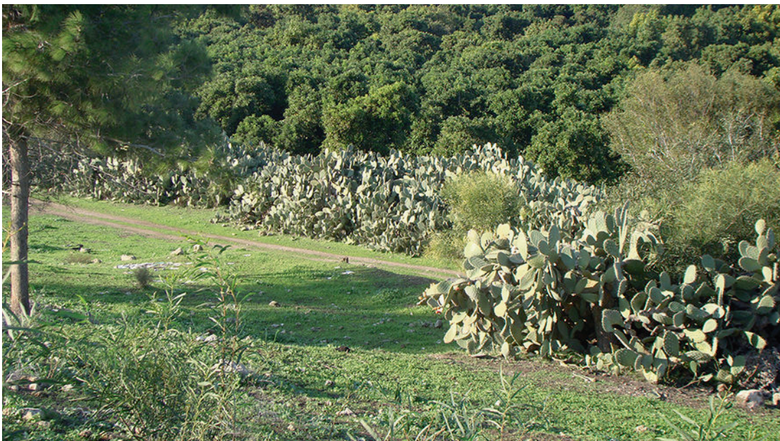
Le village palestinien Al Damun près de Acre/ Photo de Mostafa Minawi (2015).

fait un lien entre le déplacement forcé du peuple algérien par l'armée française et le déplacement forcé et la colonisation du peuple palestinien par l'armée israélienne. Tu as vu des similitudes entre les photos en noir et blanc et les vidéos tournées de 1950 à 1960 qui capturent cet exode violent et involontaire, et les lieux et scènes que tu as vécus en personne lors de ta première visite en Palestine. Je pense que c'est un bon point d'entrée. Peux-tu décrire ces similitudes et ton expérience ?