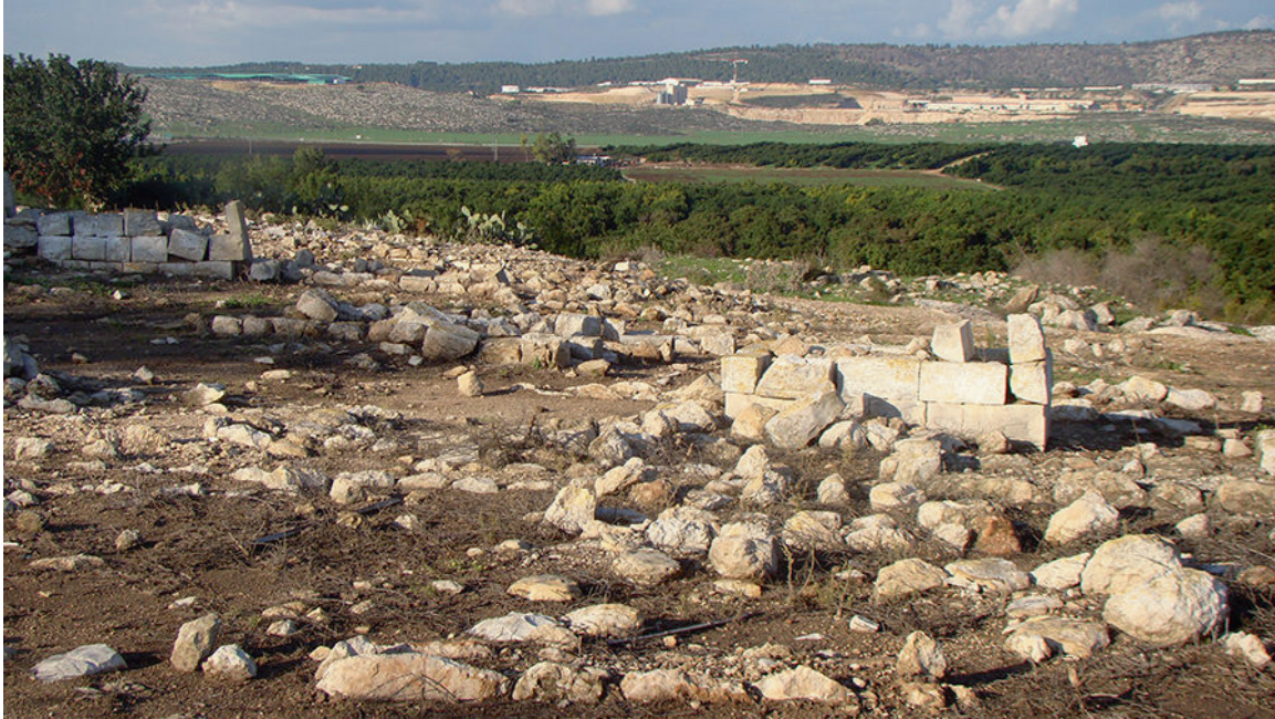
Le village palestinien Al Damun près de Acre/ Photo de Mostafa Minawi (2015).