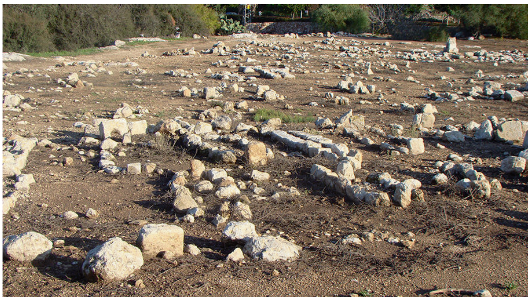
Le village palestinien Al Damun près de Acre/ Photo de Mostafa Minawi (2015).

déplacement des habitants. C'est très semblable à ce que j'ai vu en Palestine. [...] L'effort pour contrôler le récit de ces espaces se poursuit jusqu'à aujourd'hui. Ces espaces sont continuellement surveillés par l'État israélien, refusant de reconnaître qu'il y avait des villages et des villes palestiniens ayant été enterrés ou « rebaptisés », malgré leur présence bel et bien physique. [...] Ce que vous voyez, ce que vous savez et ce que vous vivez est nié. Cela était particulièrement vrai dans les endroits où les premier.e.s habitant.e.s des villages dépeuplés ont continué à vivre à proximité de leur terre natale. Lorsque ces habitant.e.s palestinien.ne.s affichaient un panneau disant « Ceci était le village de ceci et cela », la police ou l'armée venait en moins de 24 heures les arrêter.